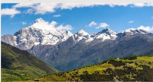
ภูเขาสี่ดรุณี (หุบเขาของเฉียวโกว)