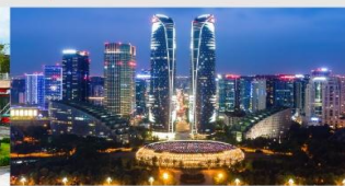
ตึกแฝดเจียงตุ

*ทางบริษัทฯ ขอสงวนสิทธิ์ในการสลับโปรแกรมทัวร์ตามความเหมาะสมขึ้นอยู่กับสถานการณ์หน้างาน โดยคำนึงถึงผลประโยชน์ของลูกค้าเป็นสำคัญ