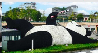
รูปปั้นหมีแพนด้าอนเซลฟ์