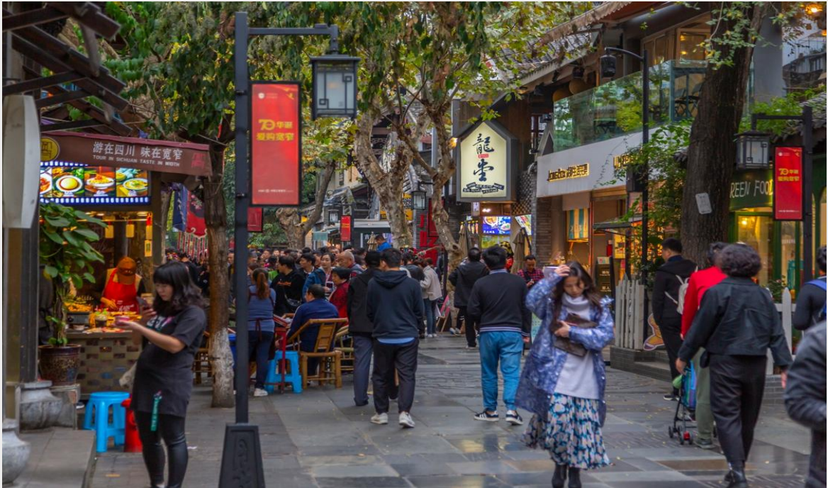
เย็น อิสระอาหารเย็นตามอัธยาศัย ณ ซอยกว้างซอยแคบ

บ่าย นำท่านสู่ ร้านหมอนไอโซน สินค้าหมอนและที่นอนยางพาราที่ผ่านกระบวนการผลิตที่มีคุณภาพ จากนั้นนำท่านสู่ ซอยกว้างซอยแคบ หรือ “ถนนควานจ้าย (Kuanxianzi Alley)” เป็นถนนที่แสดงถึงเสน่ห์ของวิถีชีวิตการเป็นอยู่ของคนจีนเฉิงตูในสมัยโบราณ ที่มีการผสมความเป็นทันสมัยเข้าไปอย่างลงตัว ถนนคนเดินมี 3 ซอย แต่ละซอยมีความยาวประมาณ 400 เมตร มีร้านค้าเล็กๆ ในแต่ละซอยให้ท่านได้อิสระเดินช้อปปิ้งตามอัธยาศัย