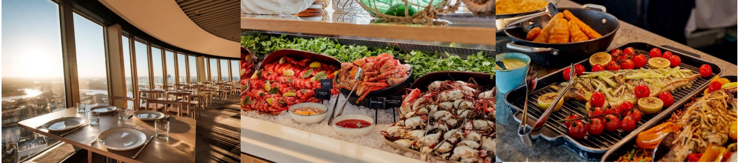
* ภาพประกอบเพื่อการโฆษณาเท่านั้น *

นำท่านขึ้นหอคอยซิดนีย์ พร้อมรับประทานอาหาร บูฟเฟต์นานาชาติ SKYFEAST AT SYDNEY TOWER RESTAURANT พร้อมชมวิวมุมสูงของนครซิดนีย์