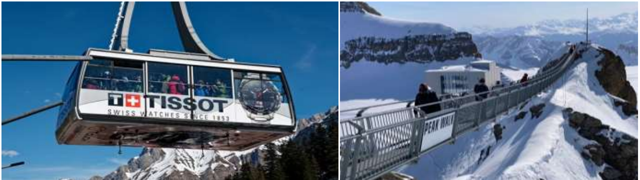
กับกิจกรรมต่างๆอย่างจุใจ ได้เวลาสมควรนำท่านลงสู่สถานีด้านล่าง

แห่งเดียวในโลกที่เชื่อมระหว่างยอดเขาสองลูก นั่นคือ Peak Walk ของ Tissot ซึ่งตั้งอยู่บน Glacier 3000 เป็นประสบการณ์ความหวาดเสียวตื่นเต้นที่น่าประทับใจ มีเวลาให้ท่านนั่งกระเช้าแบบเปิดเหมือนที่นักสกี เฟลิดเฟลิน