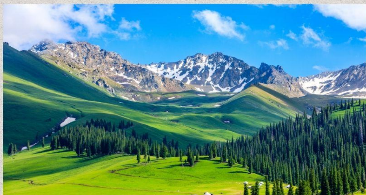
ทุ่งหญ้านาลาถี