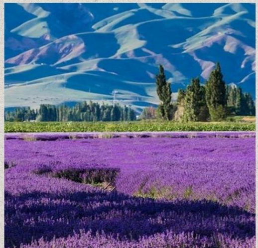
สวนดอกไม้้อีลีเทียนซาน