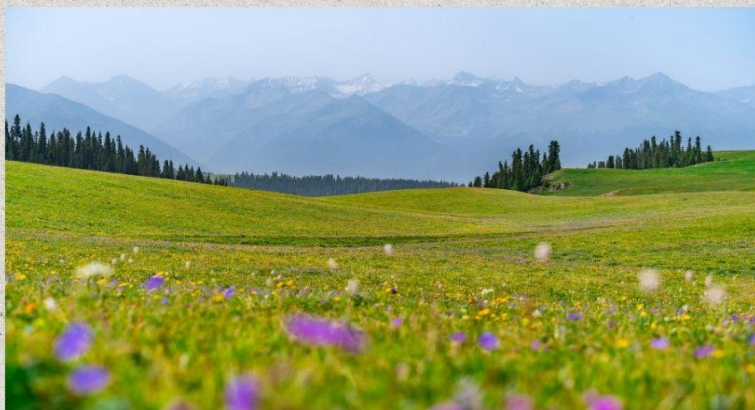
ทุ่งหญ้าคารา