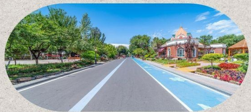
หมู่บ้านโบราณอูยกูร์คัจฉันฉี