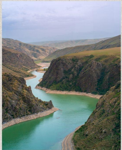
แกรนด์แคนยอนคูโคซุ