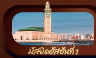
มัสยิดอัลฮันที่ 2