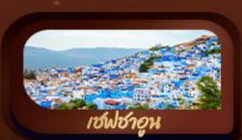
เซฟชาอูน