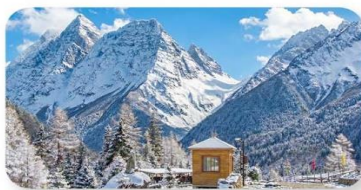
ภูเขาสี่ฤดู