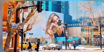
ถนนหอยไหมมิดเดิลไรด์