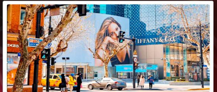
ถนนหยงไห่มิดเดิ้ลโรด