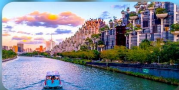
อาคารพันต้นไม้

ARTELS COLLECTION / HOLIDAY INN EXPRESS HOTEL หรือเทียบเท่า 4 คืน