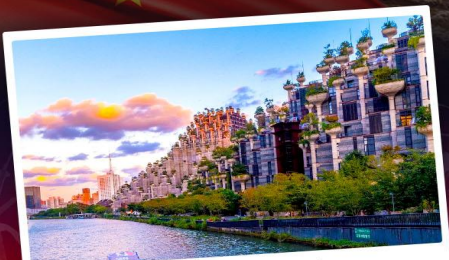
อาคารพินตันไม้

ใกล้ชิดแพนด้าแดงแสนน่ารัก SHANGHAI WILD ANIMAL PARK ชมการแสดงพลุสุดปังที่สวนสนุกดิสनीแลนด์