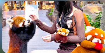
ให้อาหารแพนด้าแดง