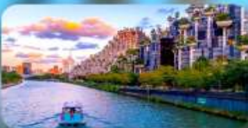
อาคารพันต้นไม้

ARTELS COLLECTION / HOLIDAY INN EXPRESS HOTEL หรือเทียบเท่า 4 คาว