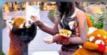
ให้อาหารแพนด้าแดง