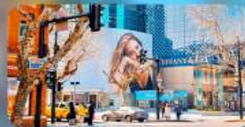
ถนนทวยไห่มีดเคิลโรด