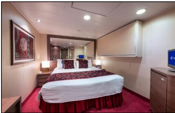
ห้องไม่มีหน้าต่าง (Inside Cabin)