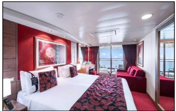
ห้องมีระเบียง (Balcony Cabin)