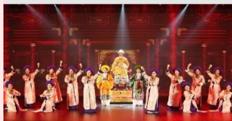
The Heritage Show