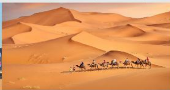
ทะเลทรายเสี่ยงชาวาน