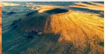
ภูเขาไฟอูลันฮาตา

*ทางบริษัทฯ ขอสงวนสิทธิ์ในการสลับโปรแกรมทัวร์ตามความเหมาะสมขึ้นอยู่กับสถานการณ์หน้างาน โดยคำนึงถึงผลประโยชน์ของลูกค้าเป็นสำคัญ