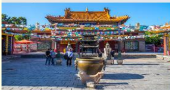
วัดต้าเจา