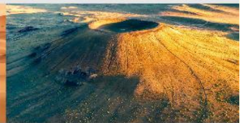
ภูเขาไฟอูลันฮาตา

*ทางบริษัทฯ ขอสงวนสิทธิ์ในการสลับโปรแกรมทัวร์ตามความเหมาะสมขึ้นอยู่กับสถานการณ์หน้างาน โดยคำนึงถึงผลประโยชน์ของลูกค้าเป็นสำคัญ