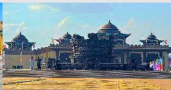
ศูนย์วัฒนธรรมหยวนหยิว