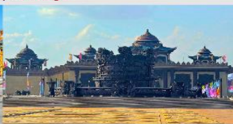
ศูนย์วัฒนธรรมหยวนหยิว