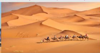
ทะเลทรายเสียงชาวน