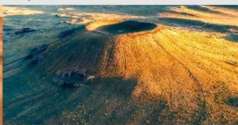
ภูเขาไฟอูลันฮาตา

*ทางบริษัทฯ ขอสงวนสิทธิ์ในการสลับโปรแกรมทัวร์ตามความเหมาะสมขึ้นอยู่กับสถานการณ์หน้างาน โดยคำนึงถึงผลประโยชน์ของลูกค้าเป็นสำคัญ