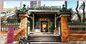
เจ้าแม่กิมกิมทิว