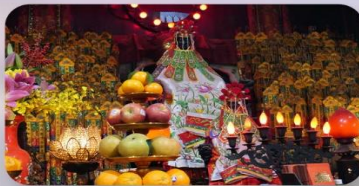
วัดกวนอิมสองฮัม