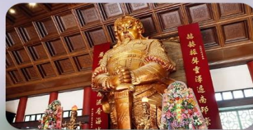
วัดกังหันแซง