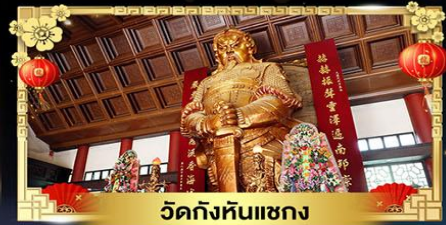
วัดกังหันแฉกง