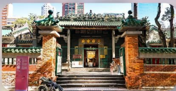
เจ้าแม่กิมกิมทิว