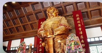
วัดกังหันแซง