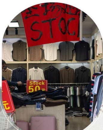
ตลาดค้าส่งอู่