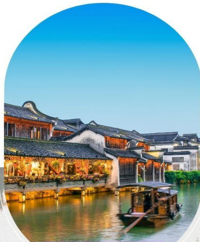
เมืองโบราณอู่เจิน