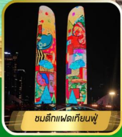
ชมตึกแฟดเทียนฟู