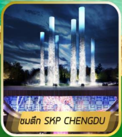
ชมตึก SKP CHENGDU