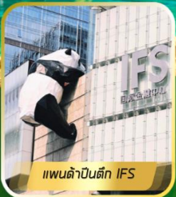
แพนด้าปีนตึก IFS