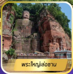
พระใหญ่เล่อซาน