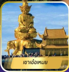
เขาเจ้อเหมย