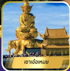
เขาเจ้อเหมย

เจียงตู • จงซิง • ต้าจู่ • อุ๋หลง • จื่อไ้ • เล่อซาน