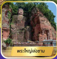
พระใหญ่เล่อซาน