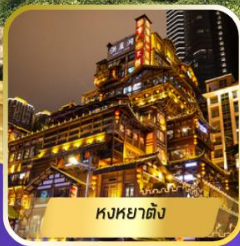
หงหยาดิง