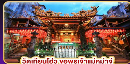
วัดเทียนฮั่ว ของพระเจ้าแม่มาจู่