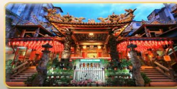
วัดเทียนโฮ่ว ของพระเจ้าแม่หม่าจู