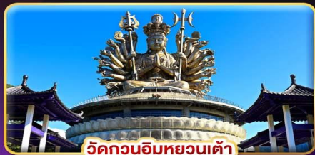
วัดกวนอิมหยวนเต้า