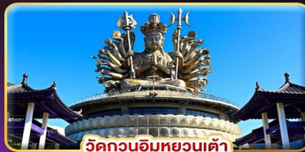
วัดกวนอิมหยวนเต้า