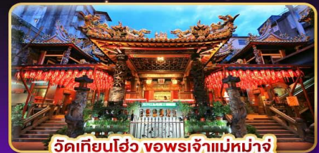
วัดเทียนโฮ่ว ของพระเจ้าแม่มาจู้