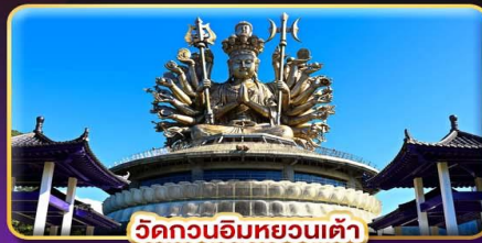
วัดกวนอิมหยวนเต้า