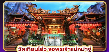
วัดเทียนฮ้อว จอพรเจ้าแม่มาจู่