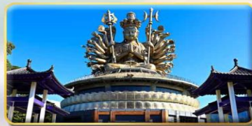
วัดกวนอิมหยวนเต้า