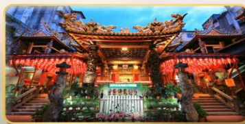
วัดเทียนโฮ่ว ของพระเจ้าแม่หม่าจู