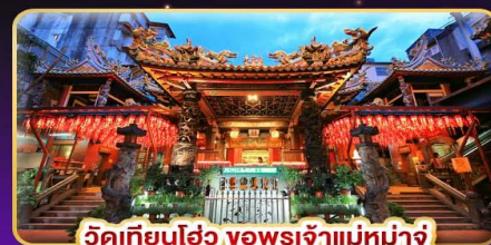
วัดเทียนฮ้อว พรเจ้าแม่มาจู้