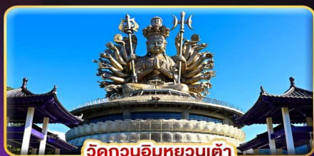
วัดกวนอิมหยวนเต้า