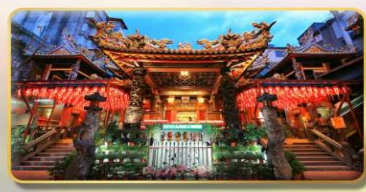
วัดเทียนโฮ่ว ของพระเจ้าแม่หม่าจู