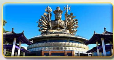
วัดกวนอิมหยวนเต้า