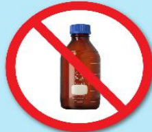
ขวดสารเคมี