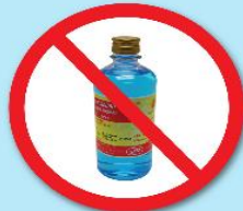
ขวดแอลกอฮอล์