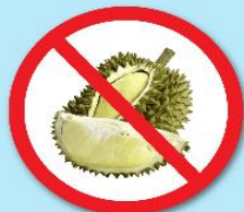
ผลไม้เขตร้อน ที่มีหนาม