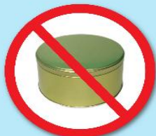
กล่องโลหะ