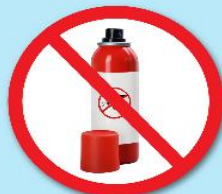
ขวดน้ำยา ฆ่าแมลง