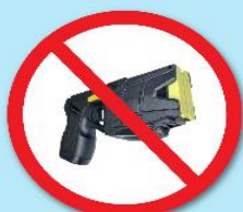
ปืนซ็อตไฟฟ้า