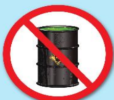
สารกัมมันตรังสี