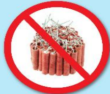
พลุ, ประทัด