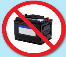
แบตเตอรี่ดำ