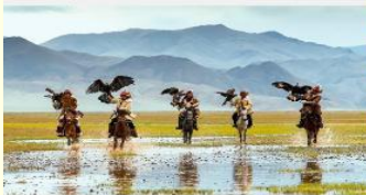
ชนเผ่ามองโกเลีย