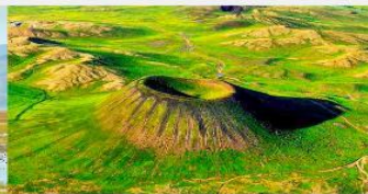
อุทยานภูเขาไฟอูลันซาตา