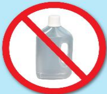
ขวดน้ำยา