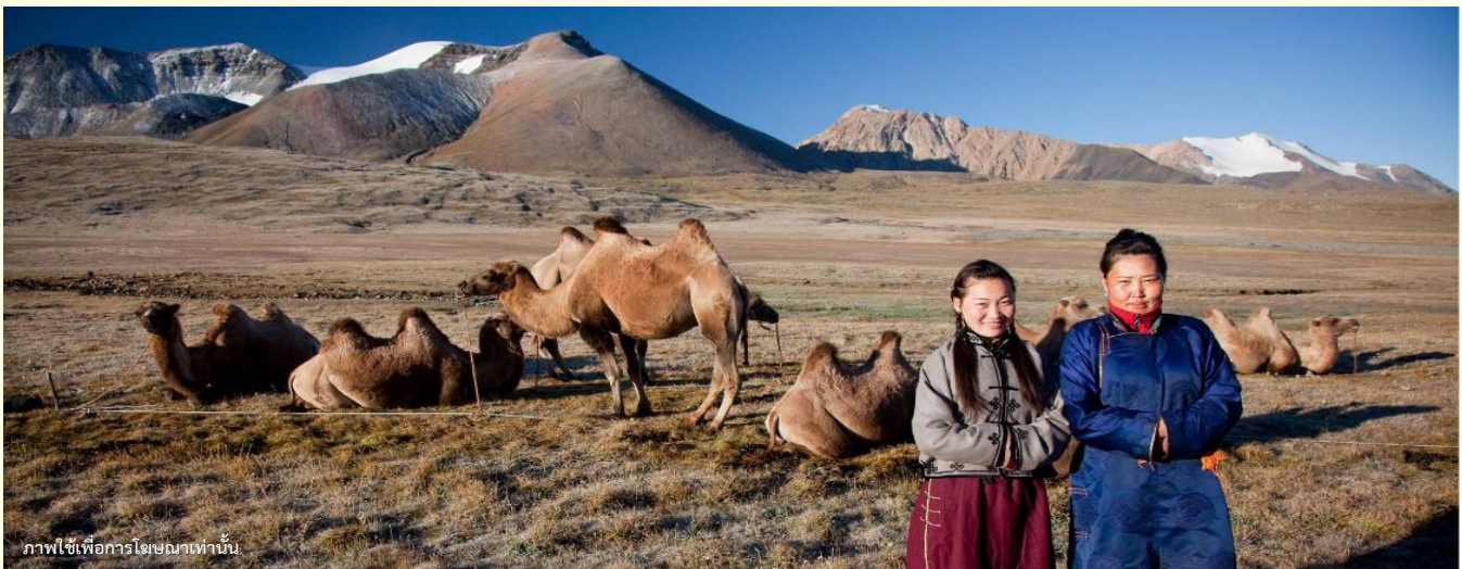
ภาพใช้เพื่อการโฆษณาเท่านั้น

นำท่านร่วมกิจกรรม พิธีต้อนรับแขกสไตล์มองโกล เป็นประเพณีโบราณที่มีมาช้านาน ชาวมองโกลมีอุปนิสัยที่รักเพื่อนฝูงและตรงไปตรงมาไม่เสแสร้ง เมื่อมีเพื่อนหรือแขกมาเยือนก็มักจะผูกมิตรอย่างจริงจัง และนำท่านร่วมกิจกรรม สวมใส่ชุดมองโกล สัมผัสพลังแห่งบรรพบุรุษ สวมเสื้อคลุมแบบดั้งเดิมที่มีสีสันสดใส ปักลวดลายอันประณีต คุณจะสัมผัสได้ถึงพลังแห่งบรรพบุรุษที่เคยปกครองดินแดนครึ่งโลก การสวมหมวกขนสัตว์ ผูกสายรัดเอว พร้อมเครื่องประดับเงินแท้ที่ส่องแสงระยิบระยับ จะทำให้ท่านเสมือนกลายเป็นนักรบแห่งทุ่งหญ้า พร้อมเครื่องประดับเงินแท้ที่ส่องแสงระยิบระยับ ของชนเผ่าที่เคยปกครองดินแดนครึ่งโลก เมื่อคุณยืนท่ามกลางทุ่งหญ้าไร้ขอบเขต