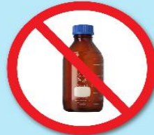
ขวดสารเคมี