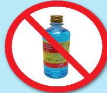
ขวดแอลกอฮอล์