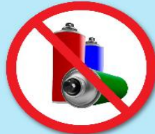
ขวดสเปรย์