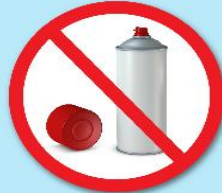
กระป๋องสเปรย์