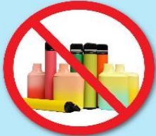
ปืนไฟฟ้า บุหรี่ยุติไฟฟ้า