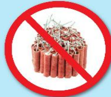
พลุ, ประทัด