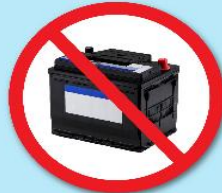
แบตเตอรี่ดำ