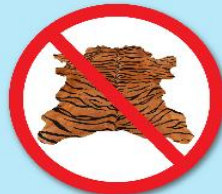
หนังเสือ