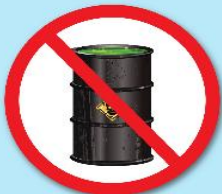
สารกัมมันตรังสี