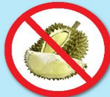
ผลไม้เขตร้อน ที่มีหนาม