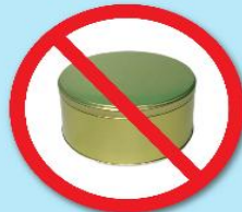
กล่องโลหะ