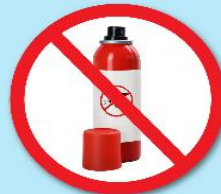
ขวดน้ำยา ฆ่าแมลง