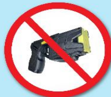
ปืนซ็อตไฟฟ้า