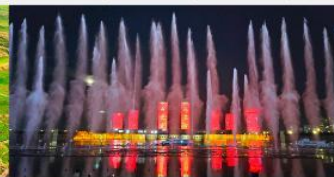
น้ำพุคังปาซื่อ