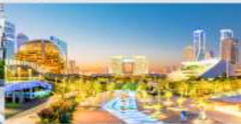
จุดชมวิว City Balcony

*ทางบริษัทฯ ขอสงวนสิทธิ์ในการสลับโปรแกรมทัวร์ตามความเหมาะสมขึ้นอยู่กับสถานการณ์หน้างาน โดยคำนึงถึงผลประโยชน์ของลูกค้าเป็นสำคัญ