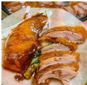
*ภาพนี้ใช้เพื่อการโฆษณาเท่านั้น*