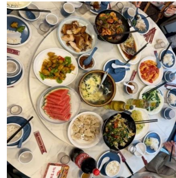
*ภาพนี้ใช้เพื่อการโฆษณาเท่านั้น*