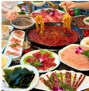
*ภาพนี้ใช้เพื่อการโฆษณาเท่านั้น*