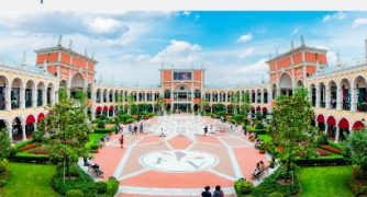
ฟรอลเลนเทีย วิลเลจ