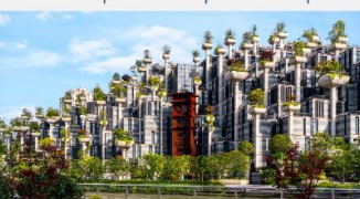
อาคารพันตันไม้