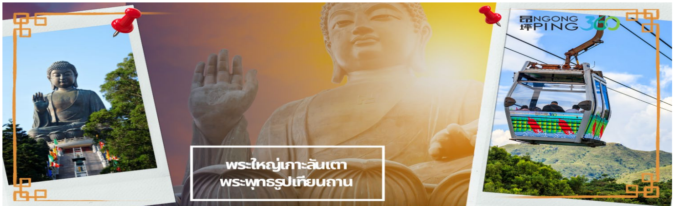
พระใหญ่เกาะลันเตา พระพุทธรูปเทียนถาน

จากนั้นเดินทางไปสถานีตุงซุง ท่านจะได้สัมผัสกับประสบการณ์ที่น่าตื่นตาตื่นใจจาก กระเช้าลอยฟ้าองปิง (NGONG PING SKYRAIL 360 **STANDARD CABIN**) ซึ่งถือได้ว่าเป็นแหล่งท่องเที่ยวอันมีเอกลักษณ์ระดับโลกของฮองกง ที่มีระยะทางกว่า 5.7 กิโลเมตร ใช้เวลาประมาณ 25 นาที ท่านจะได้สัมผัสบรรยากาศจากบนกระเช้ามุมสูง เส้นทางกระเช้าเชื่อมจากใจกลางเมืองตุงซุง ถึง หมู่บ้านวัฒนธรรมองปิง บนเกาะลันเตา ท่านจะได้ชมวิวแบบพาโนรามา 360 องศา ของสนามบินนานาชาติฮองกง ทิวทัศน์เหนือท้องทะเลของทะเลจีนใต้ ชมวิวของเนินเขาอันเขียวขจี น้ำตก ลำธาร และป่าอันเขียวชอุ่มของอุทยานบนเกาะลันเตาเหนือ (**กรณีกระเช้าองปิง 360 มีการปิดซ่อมบำรุง หรือ มีการปิดเนื่องจากสภาพอากาศแปรปรวน ทางบริษัทฯ ขอสงวนสิทธิ์ในการเปลี่ยนเป็นใช้รถโค้ชของทางอุทยานในการเดินทาง เพื่อนำท่านขึ้นสู่หมู่บ้านวัฒนธรรมองปิง บนเกาะลันเตาแทน**) จากนั้นนำท่านไปสักการะ พระใหญ่เกาะลันเตา หรือ พระพุทธรูปเทียนถาน (TIAN TAN BUDDHA STATUE) ที่ตั้งตระหง่านอยู่บริเวณริมหน้าผา เป็นพระพุทธรูปทองสัมฤทธิ์กลางแจ้งที่ใหญ่ที่สุดในโลก องค์พระทำขึ้นจากการเชื่อมแผ่นทองสัมฤทธิ์กว่า 200 แผ่น เข้าด้วยกัน น้ำหนักรวม 250 ตัน และสูง 34 เมตร หันพระพักตร์ไปทางด้านทะเลจีนใต้ และมองอย่างสงบลงมายังหุบเขาและโขดหินเบื้องล่างซึ่ง และเชิญท่านอิสระตามอัธยาศัย ลิ้มลองความอร่อยของ อาหารจีนต้นตำรับเมนู อาหารตะวันตกชั้นเลิศ หรือจะนั่งจิบกาแฟเอ็กซ์เพรสโซ่นหอมกรุ่น จากร้านอาหาร และร้านค้าคาเฟ่ในหมู่บ้านองปิง หรือบางท่านอาจจะเลือกซื้อของขวัญของที่ระลึกจากหมู่บ้านองปิง อาทิเช่น หยก ไช่มุก หรือเครื่องประดับคริสตัล เพื่อเป็นของที่ระลึก จากนั้นนั่งกระเช้ากลับลงมายังสถานีตุงซุง