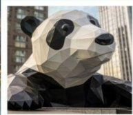
ห้าง IFS แพนด้าป็นตึก