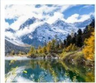
ปี้เฉิงโกว