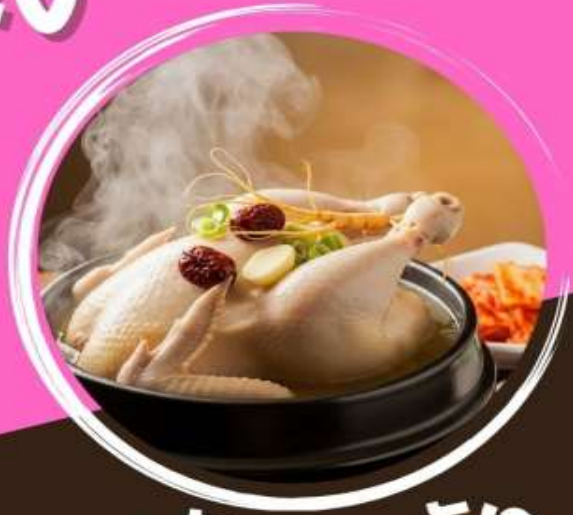
ซัมกเซท็อง