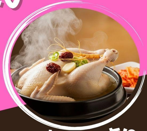
ซัมกเยตัง