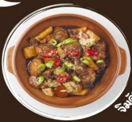
กิมจิจ๊ก