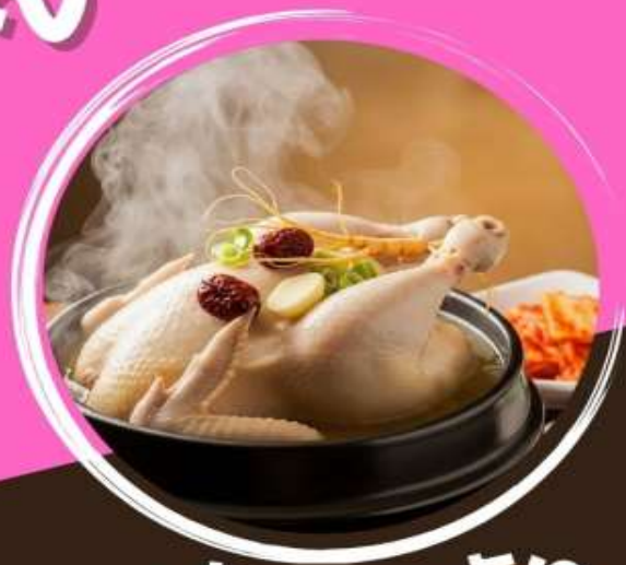
ซัมกเซท็อบ