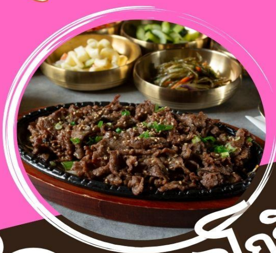
บูลโถกกี