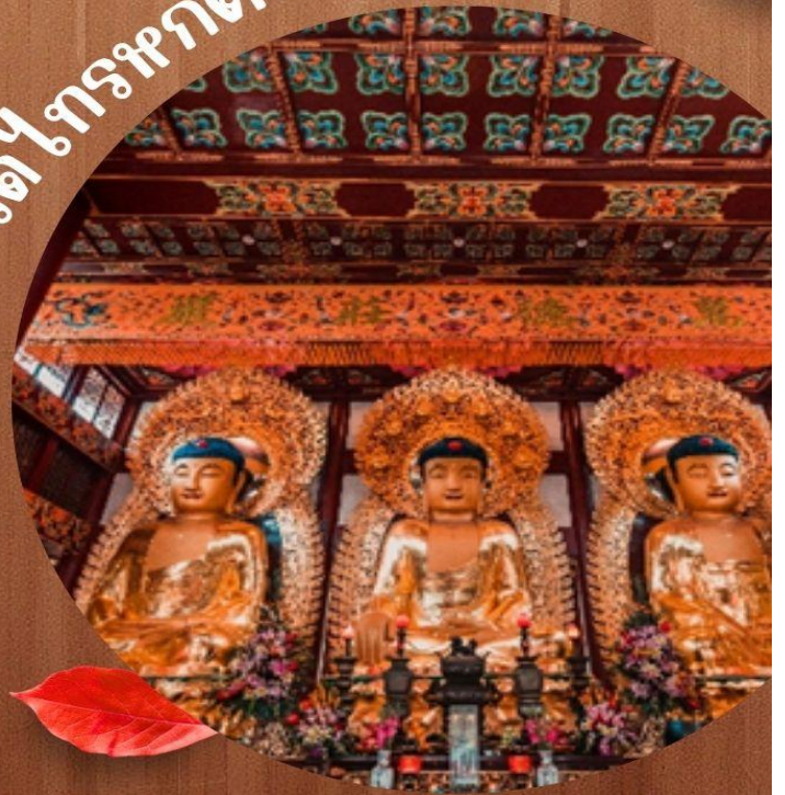
วัดไตรมิตร