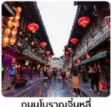
ถนนโบราณจีนหลี