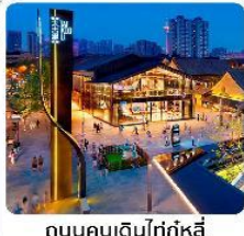
ถนนคนเดินไถ่ตู้หลี