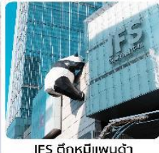
IFS ตึกหมีแพนด้า

● โฮเทล นั่งกระเช้าขึ้นชมภูเขาหิมะวาอู๋ ช้อปปิ้งถนนชุนซีลู่ แลนด์มาร์คแพนด้ายักษ์เขิงตึก IFS เจิงตู