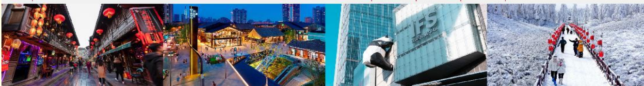
ถนนโบราณจิ้นหลี่