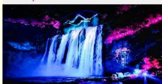
อุทยานน้ำตกหวงกั๋วซู่