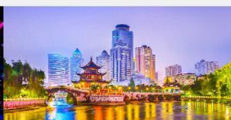
หอเจียเซียวโหลว