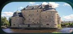
ปราสาทไอโรโบร