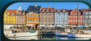
ย่านนูซาวน์