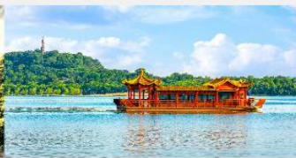
ล่องเรือทะเลสาบหลิวเยว่หู