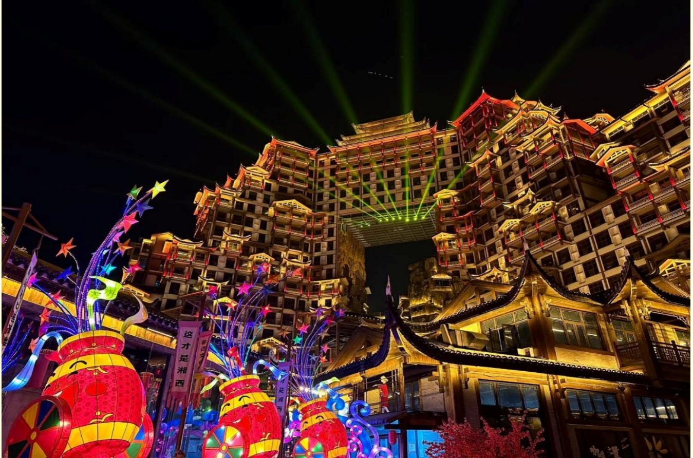
ที่พัก MELLOW CRYSTAL HOTEL โรงแรมระดับ 4 ดาว หรือเทียบเท่า