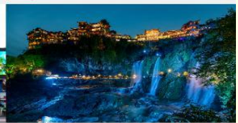
ฝูหรงเจิน

*ทางบริษัทฯ ขอสงวนสิทธิ์ในการสลับโปรแกรมทัวร์ตามความเหมาะสมขึ้นอยู่กับสถานการณ์หน้างาน โดยคำนึงถึงผลประโยชน์ของลูกค้าเป็นสำคัญ