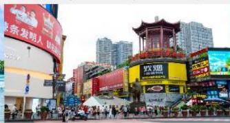
ถนนหวงซิงลู่