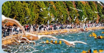
ชมฝูงนกนางนวลปากแดง