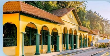
หมาห้วนมีเตอร์เกจ