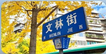
ถนนคนเดินหวินหลิน