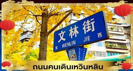
ถนนคนเดินเหวินหลิน

เที่ยวภูเขาหิมะโกล้ำๆ ชิมเพียง 2 ชั่วโมง "สัมผัสบรรยากาศความหนาวเย็นแบบถอดเขา"