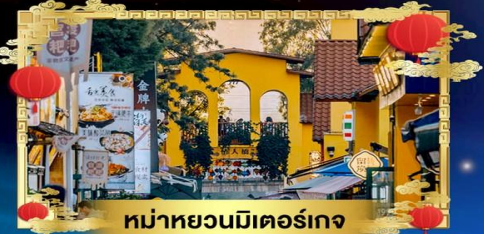
หน้าหยวนมีเตอร์เกจ