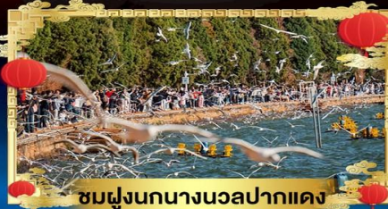
ชมฝูงนกนางนวลปากแดง