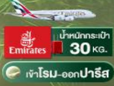
เข้าโรม-ออกปารีส

โรม ปิซ่า มิลาน โคโม ชุก ลูเซิร์น อินเตอร์ลาเคน ปารีส