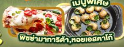
พิซซ่ามาการิตต้า, หอยออสคาโก้