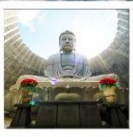
เป็นพระพุทธรเจ้า