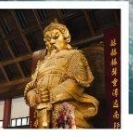
วัดซังกวมิ่ว