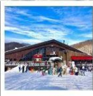
ลานสกีบังเค