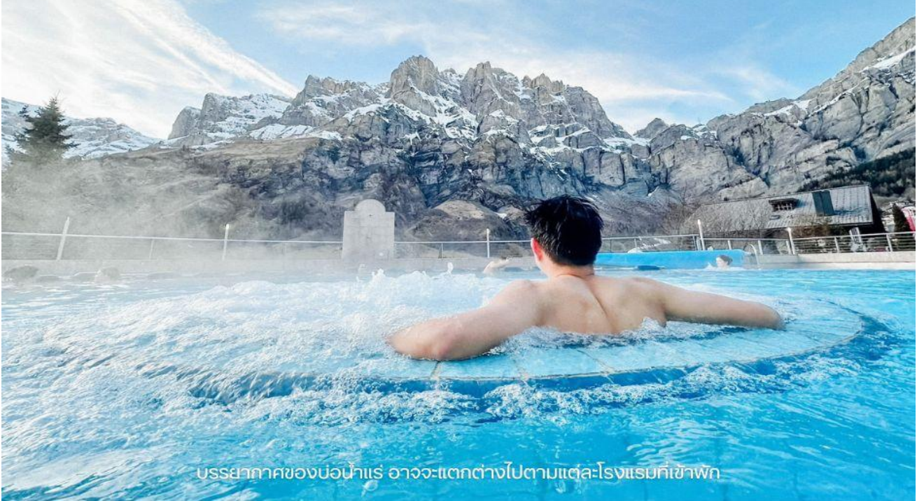
บรรยากาศของบ่อน้ำแร่ อาจจะแตกต่างกันไปตามแต่ละโรงแรมที่เข้าพัก

บรรยากาศบ่อน้ำแร่ เมืองลวยเคอร์บาร์ด บรรยากาศจริงจะมีความแตกต่างไปในแต่ละฤดูกาลท่องเที่ยว