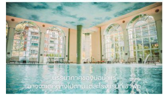
บรรยากาศของบ่อน้ำแร่ อาจจะแตกต่างกันไปตามแต่ละโรงแรมที่เข้าพัก