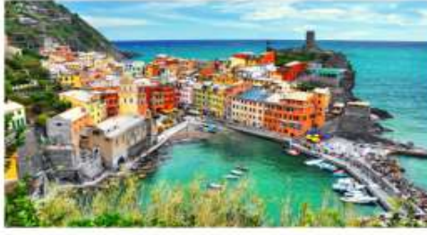
Breathtaking, Stunning, Charming, and Picturesque ("น่าประทับใจ", "น่าทึ่ง", "มีเสน่ห์" และ "งดงาม")

พักโรงแรมระดับ 4 ดาว ลิ้มรสอาหารพิเศษ ที่ถูกคัดสรรมาในเพื่อท่าน ทั้งอาหารพื้นเมืองอิตาลี พร้อมไวน์ท้องถิ่น, อาหารจีน และอาหารไทยรสเลิศ ค่าทิปพนักงานขับรถและบริกร ในยุโรป บริการนำสัมภาระตลอดการเดินทาง