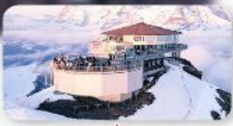
ทานอาหารที่ Piz Gloria กั้ตาคารกั้หมุนได้ 360 องศา