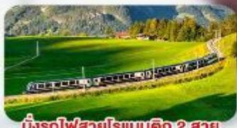
นั้รถไฟสายโรแมนติก 2 สาย Golden Pass / Luzern Interlaken Express