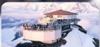
ทานอาหารที่ Piz Gloria ทัศนียภาพที่ทิวทัศน์ได้ 360 องศา