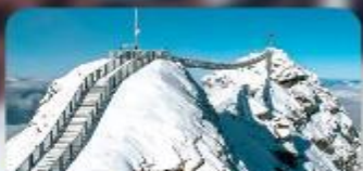
พิชิต 3 ยอดเขาดัง Rigi / Schilthorn / Glacier 3000