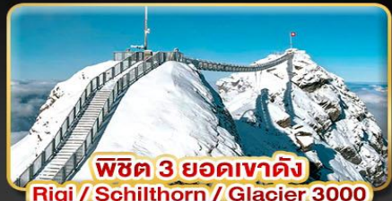
พิซิต 3 ยอดเขาตั้ง Rigi / Schilthorn / Glacier 3000