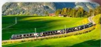
นั่งรถไฟสายโรแมนติก 2 สาย Golden Pass / Luzern Interlaken Express