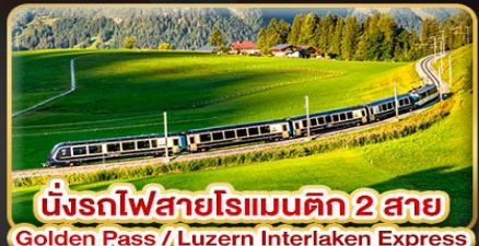
นั่งรถไฟสายโรแมนติก 2 สาย Golden Pass / Luzern Interlaken Express